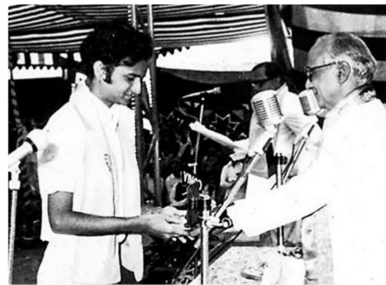
नागपूरमधील पदवीपदान समारंभात सुवर्णपदक स्वीकारताना

९ वाजता गुरुजींकडे जायचो, त्यांच्याकडून १२ वाजता घरी येऊन दुपारी २ वाजताच्या सुमारास पुन्हा जायचो. रात्री घरी स्वतःचा रियाज सुरू होताच. रियाज ही नियमित करण्याची गोष्ट असल्यामुळे आमच्यासाठी सर्व दिवस सारखे होते. ‘गद्देपंचविशी’ या शब्दात अपेक्षित असतो तसा तरुण वयात घडणारा अविचार माझ्याबाबतीत घडला नाही, याचं कारण इथं होतं. एका लक्ष्यानं आणि स्वप्नानांच आम्ही सर्वजण तिथे एकत्र आलो होतो. संगीतसाधनेत गुरू किती महत्त्वाचा असतो, हे मला या काळात प्रकर्षानं जाणवलं. मी लहानपणापासून संगीताच्या सान्निध्यात वाढलो आणि तेव्हापासूनच गातही होतो. संगीत सर्वांमध्ये सहभागी होत होतो, १४ व्हा-१५ व्या वर्षापासूनच जाहीर कार्यक्रमांमध्ये गाण्याची संधी मला मिळू लागली होती. लहानपणी या सगळ्यांचं लोकांकडून खूप कौतुक होत असे. आता मी हे मान्य करतो, की ते माझं गाणं काही अप्रतिम म्हणावं असं नव्हतं, पण अनेकदा ‘मी किती छान गायला’ असं मलाच वाटून जात असे. अशा ठिकाणी तुम्हाला तुमची ओळख करून देणारा गुरू गरजेचा असतो.